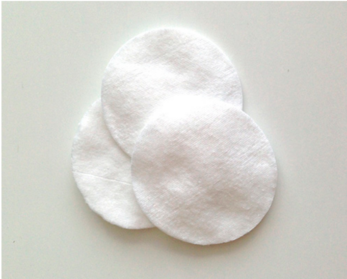
Make up Pads