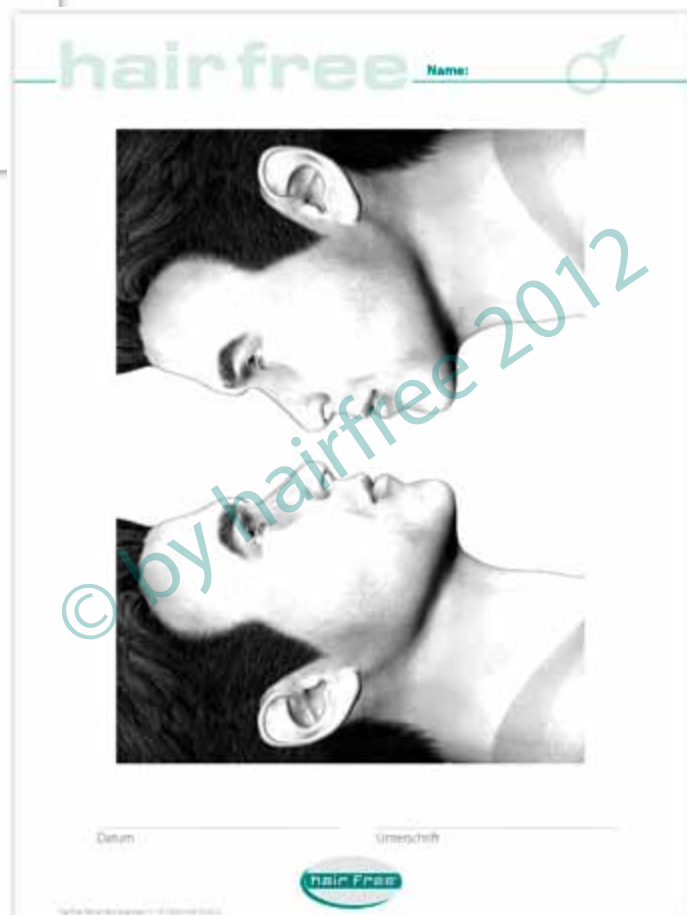
Formular „Areal Gesicht Mann“