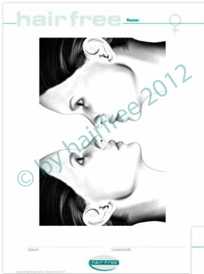
Formular „Areal Gesicht Frau“