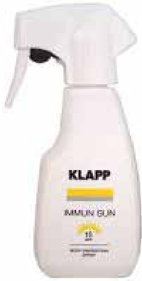
Immun Sun Body Spray