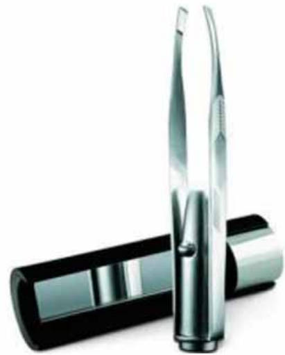
Pinzette mit LED